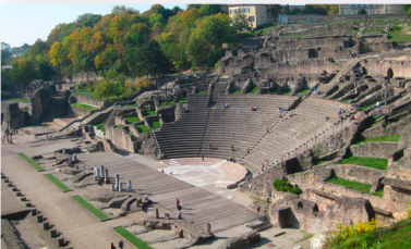
Théâtre Gallo-Romains 6 Rue de l'Antiquaille 69000 LYON