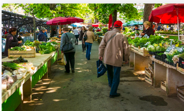
Marché alimentaire Saint-Antoine Quai Saint-Antoine 69002 LYON