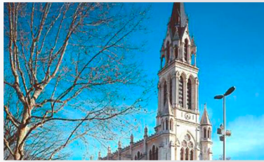
Église Sainte-Blandine 1 Place de l'Hippodrome 69002 LYON