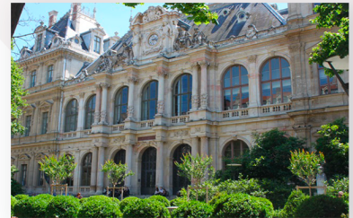
Palais de la Bourse Place de la Bourse 69002 LYON 04 72 40 58 79