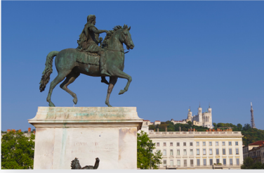
Statue Louis XIV Place Bellecour 69002 LYON