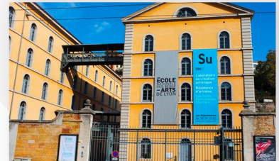
Les Substances 8 bis Quai Saint-Vincent 69002 LYON 04 78 39 10 02