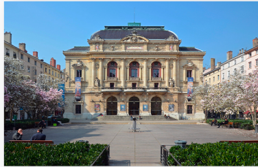
Théâtre des Célestins 4 Rue Charles Dullin 69002 LYON 04 72 77 40 00