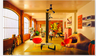
Musée Miniatures & Cinéma 60 Rue Saint-Jean 69002 LYON 04 72 00 24 77