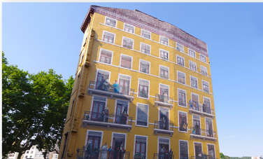
Fresque des Lyonnais 2 Rue de la Martinière 69002 LYON