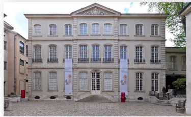
Musée des Tissus & des Arts Décoratifs 34 Rue de la Charité 69002 LYON 04 78 38 42 00