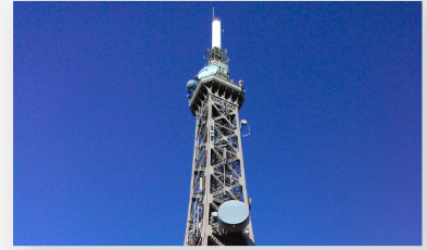
Tour Métallique de Fourvière 8 Montée Nicolas de Lange 69002 LYON