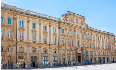
Musée des Beaux-Arts de Lyon 20 Place des Terreaux 69002 LYON 04 72 10 17 40