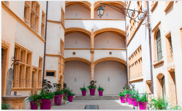
Musée Gadagne 1 Place du Petit Collège 69002 LYON 04 78 42 03 61