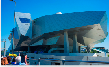
Musée des Confluences 86 Quai Perrache 69002 LYON 04 28 38 12 12