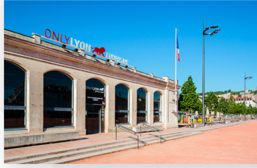
Office du Tourisme Place Bellecour 69002 LYON 04 72 77 69 69