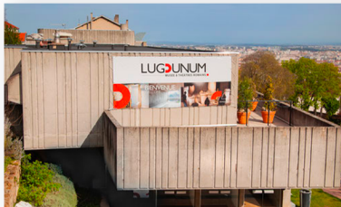
Musée Lugdunum 17 Rue Cléberg 69000 LYON 04 72 38 49 30