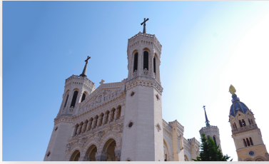
Basilique Notre Dame de Fourvière 8 Place de Fourvière 69002 LYON

Fourvière - 3 Place Fourvière 69000 LYON