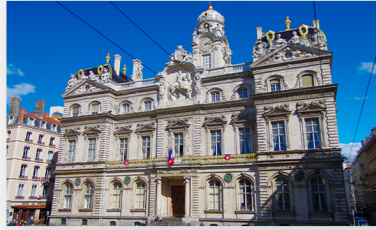
Hôtel de Ville de Lyon 1 Place de la Comédie 69002 LYON 04 72 10 30 30