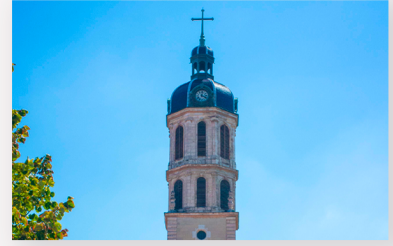
Clocher de la Charité Place Antonin Poncet 69002 LYON