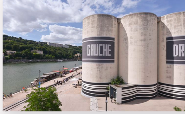
La Sucrière 40-50 Quai Rambaud 69002 LYON 04 27 82 69 40