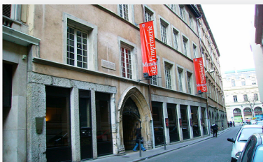
Musée de l'imprimerie & de la communication graphique 13 Rue de la Poulallerie 69002 LYON 04 78 37 65 98