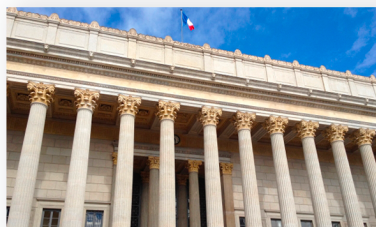
Palais de Justice 1 Rue du Palais de Justice 69002 LYON