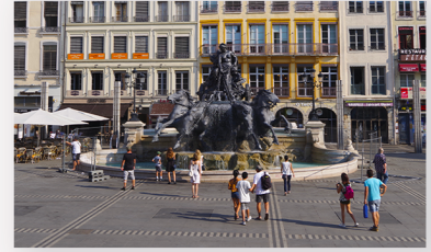
Fontaine Bartholdi Place des Terreaux 69002 LYON