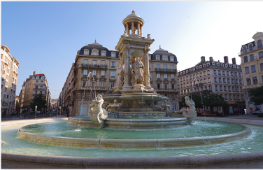
Fontaine des Jacobins Place des Jacobins 69002 LYON