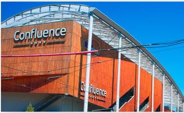
Pôle de Commerce & de Loisirs 112 Cours Charlemagne 69002 LYON