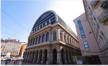
Opéra de Lyon 1 Place de la Comédie 69002 LYON 04 69 85 54 54