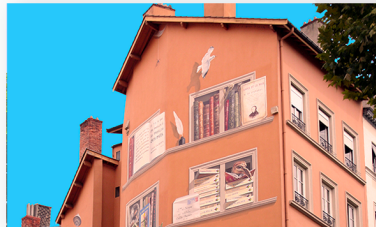
Mur Peint Bibliothèque 6 Rue de la Platière 69002 LYON