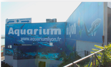
Aquarium 7 Rue Stéphane Déchant 69000 LYON 04 72 66 65 66