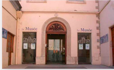
Musée d'Art Religieux 7-8 Place de Fourvière 69002 LYON 04 78 25 13 01