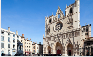
Cathédrale Saint-Jean Place Saint-Jean 69002 LYON