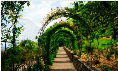
Parc des Hauteurs

Parc des Hauteurs - Rue Jaricot, Angle Chemin du Viaduc 69000 LYON