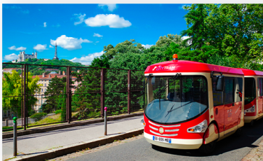
Lyon City Tram 17 Rue Paul Chenavard 69002 LYON 04 78 56 32 39

Chenavard - 10 Rue Paul Chenavard 69002 LYON